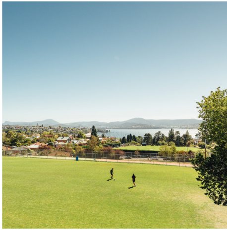
บริเวณโรงเรียนที่มองเห็นแม่น้ำเดอร์เวนท์

การเลือกโรงเรียนชายมีข้อดีหลายประการ ที่ฮัทชินส์เราจัดเตรียมพื้นที่การเรียนรู้ที่ออกแบบมาโดยเฉพาะสำหรับการสอนเด็กผู้ชาย ซึ่งรวมถึงการจัดหาทรัพยากรและการออกแบบโปรแกรมที่ตอบสนองความต้องการด้านการศึกษาและการพัฒนาของพวกเขา เราจ้างคณาจารย์ที่มีใจรักในการสอนและได้รับการพัฒนาวิชาชีพอย่างต่อเนื่องในด้านการปฏิบัติที่ดีที่สุด การเรียนรู้ที่เป็นนวัตกรรมและสร้างสรรค์