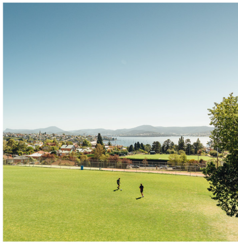
Các khu đất của Trường nhìn ra Sông Derwent.

Việc chọn trường nam sinh có nhiều điểm lợi. Tại Hutchins, chúng tôi cung cấp các không gian học tập được thiết kế riêng để dạy nam sinh, bao gồm việc cung cấp các nguồn lực và chương trình thiết kế đáp ứng nhu cầu giáo dục và phát triển của các em. Chúng tôi tuyển các giáo viên say mê dạy học và thường xuyên trau dồi nghề nghiệp về học tập theo thông lệ tốt nhất, mang tính đổi mới và sáng tạo.